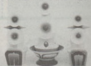
ธอร์มา จากทิเบต