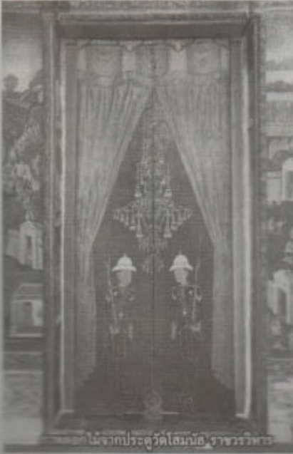
ดอกไม้จากประเพณีโสมก้อ ราชพรรษา

การพิพิธภัณฑ์วัฒนธรรมดอกไม้ เผยว่า ภายในจะจัดแสดงชิ้นงาน หลักฐาน ภาพถ่ายไปจนถึงไม้ดอกไม้ใบ ซึ่งรวบรวมมาจากทุกทวีปในตลอดช่วงชีวิตการทำงานในฐานะศิลปินนักจัดดอกไม้โดยได้เดินทางไปลงมือจัดดอกไม้คลุกคลีอยู่ ซึ่งจะเกี่ยวข้องกับวัฒนธรรมของหลายประเทศ แต่ที่นี้จะเน้นไทยและเอเชีย ให้ได้เห็นว่ามีการใช้ดอกไม้อย่างไร ดอกไม้อยู่ในวิถีชีวิตของดอกไม้กับวิถีชีวิตของคน