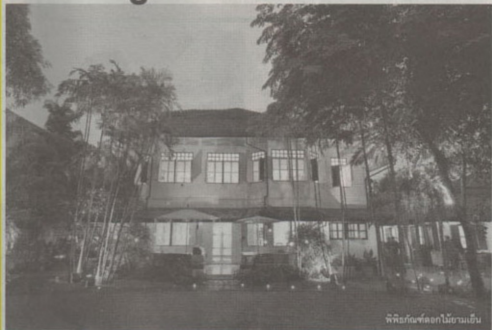
พิพิธภัณฑ์ดอกไม้ยามเย็น