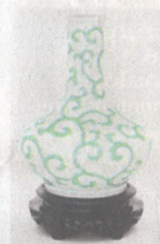
สิ่งจัดแสดง ภายในพิพิธภัณฑ์

สไตลโคโลเนียลอายุราว 100 ปี ตั้งอยู่บริเวณศรีย่าน แบ่งเป็น ชั้นที่ 1 "หอภาพวาด" จัดแสดงภาพถ่ายโบราณของงานดอกไม้ไทยในอดีตที่สืบค้นได้จากหอจดหมายเหตุแห่งชาติ กรมศิลปากร รวมทั้งภาพถ่ายโบราณวิถีชีวิตของผู้คน และงานสถาปัตยกรรมในอดีตของเขตคูสิต