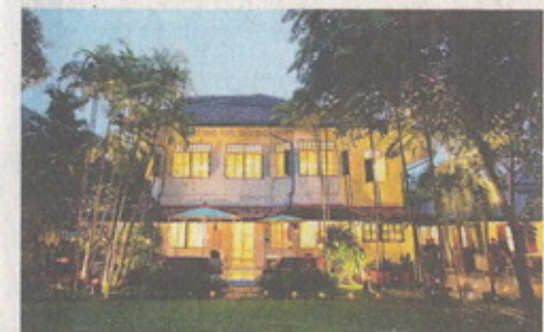
พิพิธภัณฑ์ในบ้านโบราณอายุ 100 ปี

จากประสบการณ์ในต่างแดน ทำให้สังสมเรื่องราวต่างๆ ไข่มุกมาย จึงคิดรวบรวมผลงานและของสะสมทุกอย่าง กลายเป็นที่มาของ "พิพิธภัณฑ์วัฒนธรรมดอกไม้" (The Museum of Floral Culture) พิพิธภัณฑ์ที่ว่าด้วยเรื่องวัฒนธรรมดอกไม้แห่งแรกและแห่งเดียวของโลก บรรจุนิทรรศการและหลักฐานทางประวัติศาสตร์เกี่ยวกับการจัดดอกไม้จากอดีตถึงปัจจุบัน ทั้งของไทยและนานาชาติ ซึ่งจะเปิดอย่างเป็นทางการในวันที่ 12 ส.ค.นี้