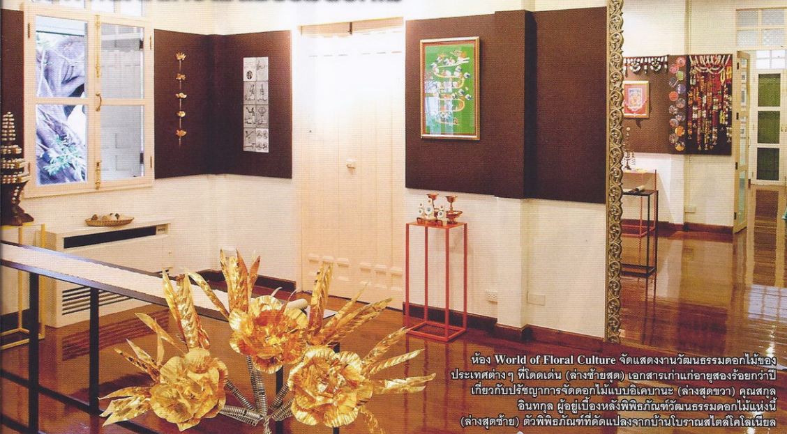
ห้อง World of Floral Culture จัดแสดงงานวัฒนธรรมดอกไม้ของประเทศไทย ที่โดดเด่น (ล่างซ้ายสุด) เอกสารเก่าแก่อายุสองร้อยกว่าปีเกี่ยวกับปรัชญาการจัดดอกไม้แบบอิตาเลียน (ล่างสุดขวา) คุณสกุล อินทกุล ผู้อยู่เบื้องหลังพิพิธภัณฑ์วัฒนธรรมดอกไม้แห่งนี้ (ล่างสุดซ้าย) ตัวพิพิธภัณฑ์ที่ดัดแปลงจากบ้านโบราณสไตล์โคโลเนียล